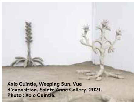
Xolo Cuintle, Weeping Sun. Vue d'exposition, Sainte Anne Gallery, 2021.