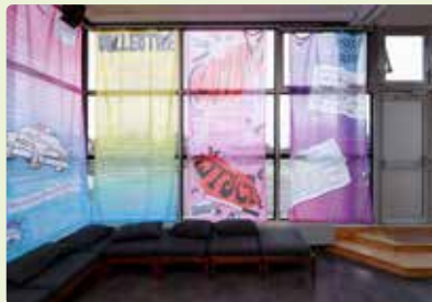
Vue de l'exposition «Læ collectiv·fe», Bye Bye Binary. Commissaire: Céline Poulin. Co-production CAC Brétigny—Théâtre Brétigny, 2023.

Le CAC Brétigny est ouvert du mardi au samedi de 14h à 18h, ainsi que les soirs et dimanches de représentation au Théâtre Brétigny. L'entrée est libre et gratuite.