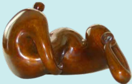
Contemplation - Linh Pham-Gia