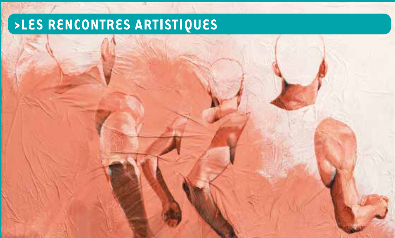
Trio d'hommes - Vincent Dogna

Les arts vont investir la salle Maison Neuve du samedi 2 au dimanche 10 octobre à l'occasion de la 4 ème édition des Rencontres Artistiques organisées par la ville de Brétigny-sur-Orge.