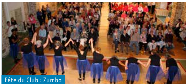
Fête du Club : Zumba

Nombre de personnes : 40. Tarif : 2,85€, hors commune 4,40€. Sur inscription. Rendez-vous à 13h30 au Club.