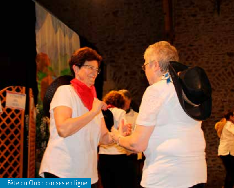
Fête du Club : danses en ligne