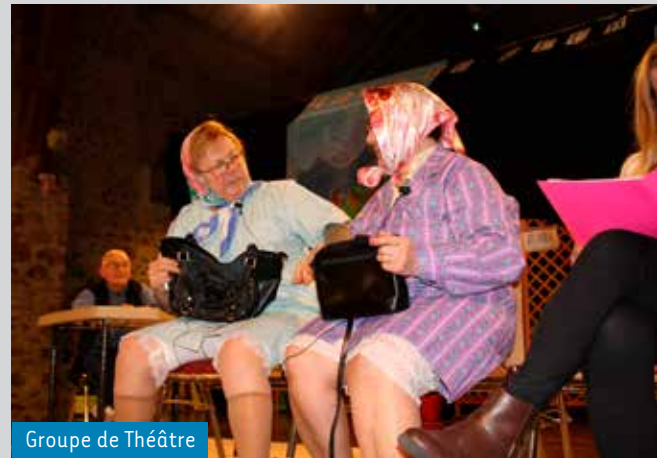
Groupe de Théâtre

Vous souhaitez faire paraître une information dans L'actu des Seniors :