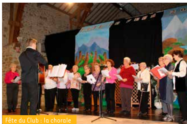
Fête du Club : la chorale

VISITE GUIDÉE DU CHÂTEAU DE GUÉDELON Au cœur de la Puisaye, dans l'Yonne, en Bourgogne, une cinquantaine d'œuvriers relèvent un défi hors-norme : construire aujourd'hui un château fort selon les techniques et avec les matériaux utilisés au Moyen Âge. Nombre de personnes : 50. Tarif entrée 11€ + visite guidée du château 90€ pour le groupe. Transport, maximum 28,46€, minimum 17,07€. Inscription avant le 15 août. Restauration sur place ou pique-nique à la charge des participants. 1 er rendez-vous à 7h45 à la Moinerie puis autres points d'arrêts.